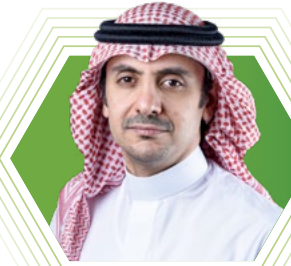
سعادة المهندس أيمن بن إسحاق أفغاني

وزير النقل والخدمات اللوجستية عضو مجلس الإدارة