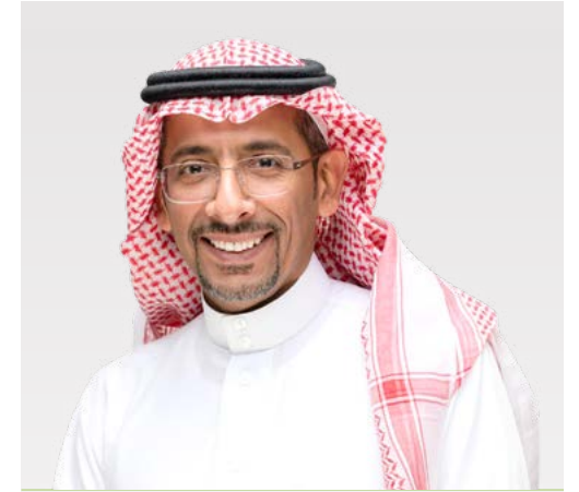
معالي الأستاذ بندر بن إبراهيم الخريف

وزير الصناعة والثروة المعدنية رئيس مجلس الإدارة