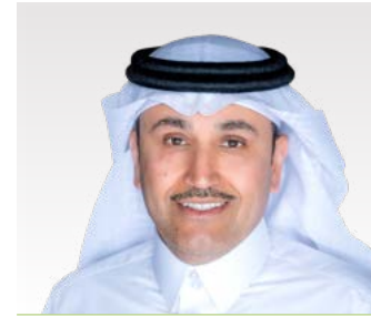
معالي المهندس صالح بن ناصر الجاسر

وزير الصناعة والثروة المعدنية رئيس مجلس الإدارة