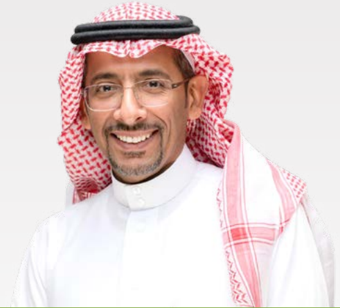
كلمة معالي رئيس مجلس الإدارة بندر بن إبراهيم الخريف وزير الصناعة والثروة المعدنية

إن التميز الواضح والدور الفاعل والأثر الملموس الذي حققه الصندوق، يتلخص في ثلاثة أمور أساسية: أولها، التأسيس الصحيح لهذا الكيان منذ نشأته من خلال الدخول بالشراكة مع بنك Chase Manhattan، ثانياً، التزام الصندوق طوال مسيرته بنطاق عمله بدعم القطاع الصناعي، وأخيراً التركيز على تطوير الكادر البشري، وبناء القيادات التي نفتخر بها اليوم في كثير من المواقع القيادية بالقطاع الحكومي والخاص. واستطاع الصندوق بعد هذه الرحلة التاريخية، أن يكون لاعباً مهماً في مرحلة ما بعد إطلاق رؤية السعودية 2030، وأن يعيد صياغة دوره التنموي، بصفته شريكاً حقيقياً لتحقيق مستهدفات الرؤية، من خلال تعديل نظامه الأساسي بقرار مجلس الوزراء، وتوسيع مهامه لتشمل دعم القطاعات الأربعة لبرنامج ندلب (الصناعة، والتعدين، والطاقة، والخدمات اللوجستية)، وذلك بهدف تعظيم دور هذه القطاعات في الاقتصاد الوطني.